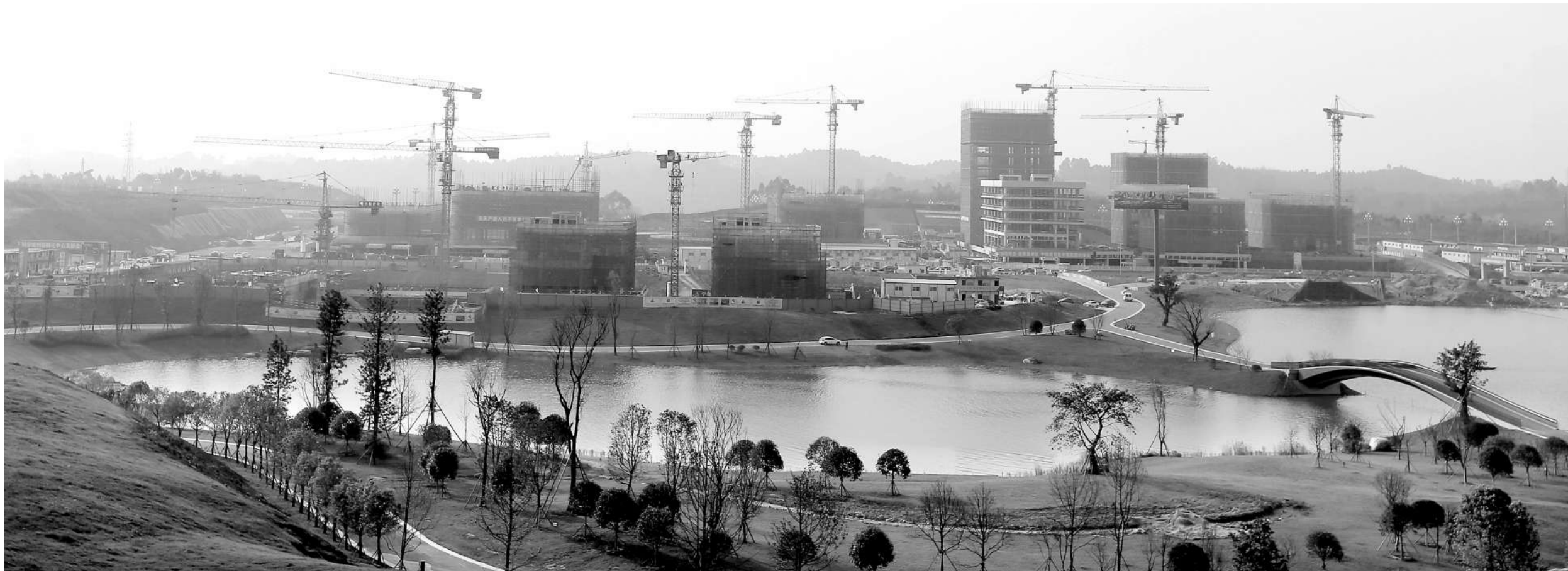
兴隆湖畔，天投集团负责的项目正在热火朝天地进行建设

2016年，是天府新区成都党工委、管委会确定的项目攻坚年，作为天府新区成都直管区内目前唯一的市属国有独资公司，成都天府新区投资集团有限公司（以下简称天投集团）主营业务涉及天府新区成都直管区范围内的基础设施建设、房地产开发、区域开发和总部经济与循环经济发展等业务。