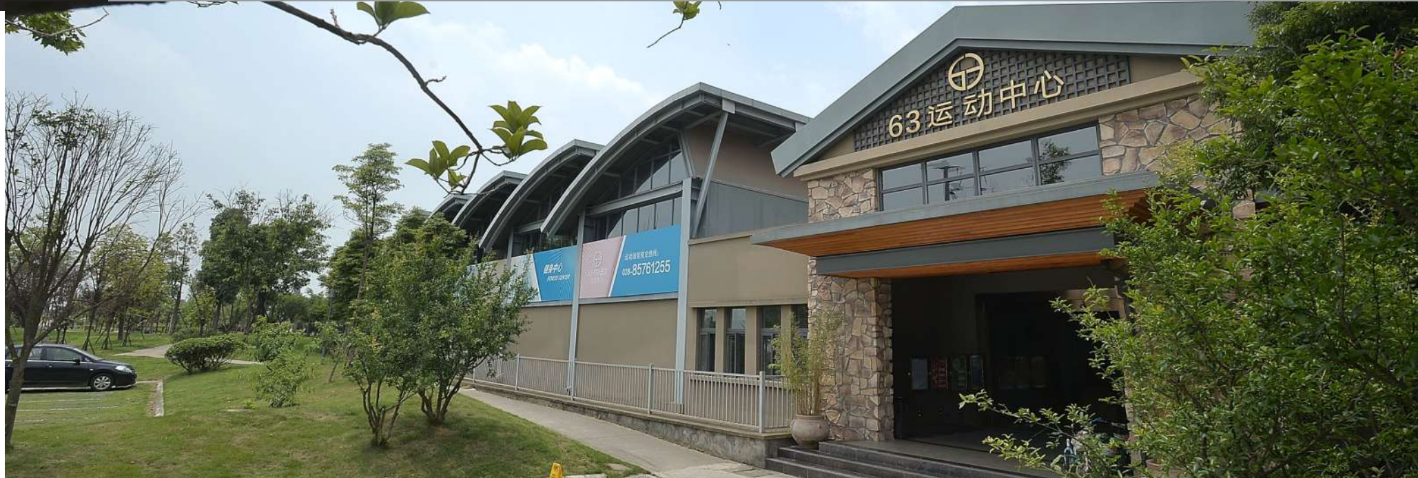
万安体育公园是广大人民群众锻炼健身、休闲娱乐的好去处