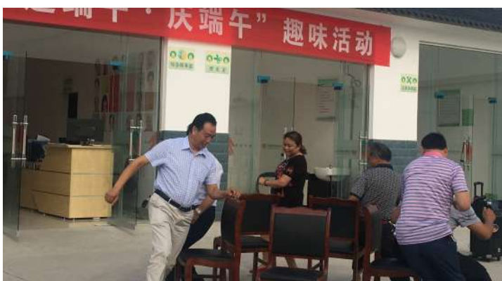
兴隆举行庆端午趣味活动

接下来是如火如荼的“套圈大赛”趣味游戏,只见一位大爷猫着腰,微眯着眼,准头瞄了又瞄,“咻”地扔出一个小黄圈,“套中了!套中了!”大爷还没来得及看,围观群众先报出了喜讯,“大爷好厉害,快去领张