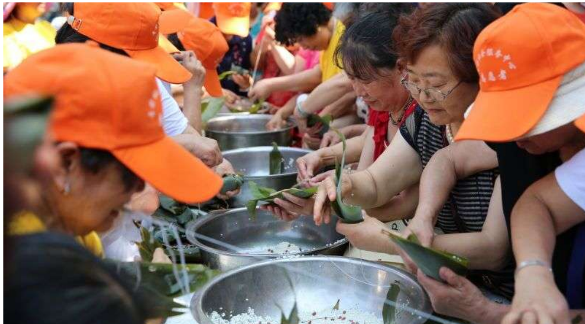
华阳街道将碑社区举办包粽子活动,让邻里之间的关系更加和谐

端午节期间,有的社区开展了慰问老人的活动,志愿者们放弃休息,纷纷走进养老院、社区,为孤寡老人等送去慰问和祝福;有的社区开展家训树家风的活动,有的社区则是召集左邻右舍一起亲手包粽子……不同的节日都只有一个主题,就是为市民送上温馨的节日祝福,也让人们在欢乐的氛围中感受传统节日的魅力。