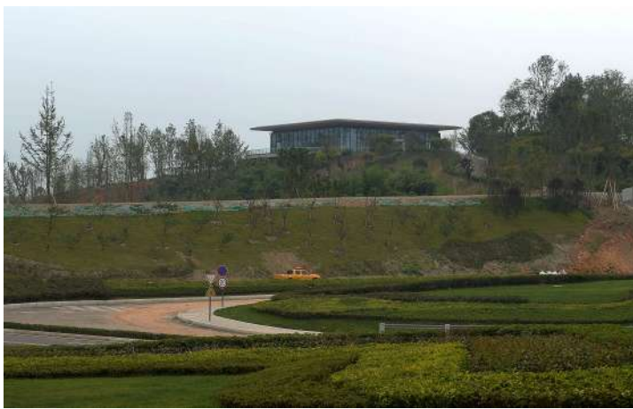
山地公园处处绿色,生机盎然

一整块大理石,上面雕刻着“万安体育公园”几个大字,一个五环图案构成了公园的开放式大门。在公园里,除了常规的绿树和座椅,设施非常齐全,这里有健身房,让你告别会议室,告别电脑桌,在私人教练专业指导下挥洒汗水,享受属于自己的有氧空间。这里还有羽毛球馆、乒乓球馆、篮球场,让你可以脱掉西装,换上皮鞋,与朋友一起在汗水中轻松微笑。在户外游乐场里,你可以和孩子们一起收获童年的快乐,在各种游乐设施里尽享最美好的亲子时光。你还可以在文化广场跳舞,在公园里骑自行车、慢跑、轮滑,在这里,一座公园,是一种生活。