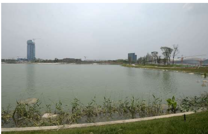
生机勃勃的天府公园如同一颗璀璨的明珠