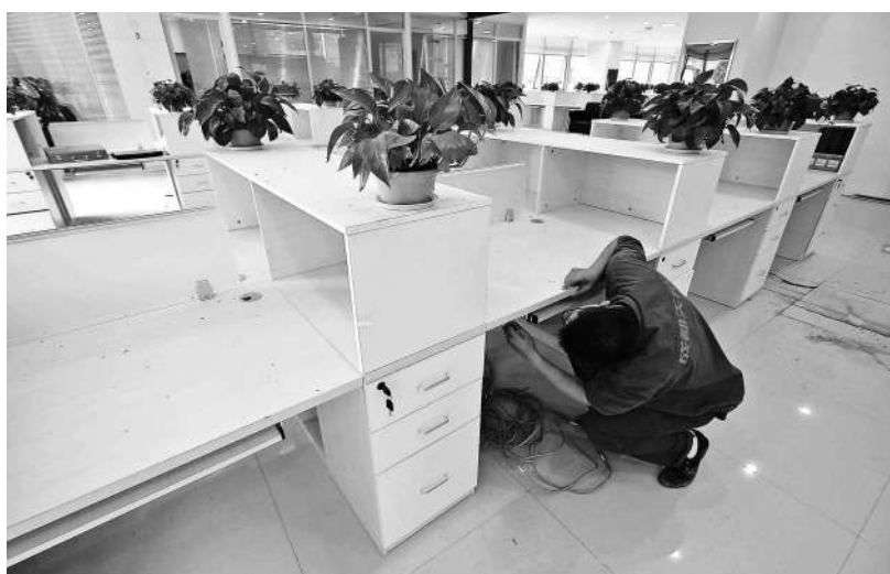
工人正在对办公区进行最后的装修