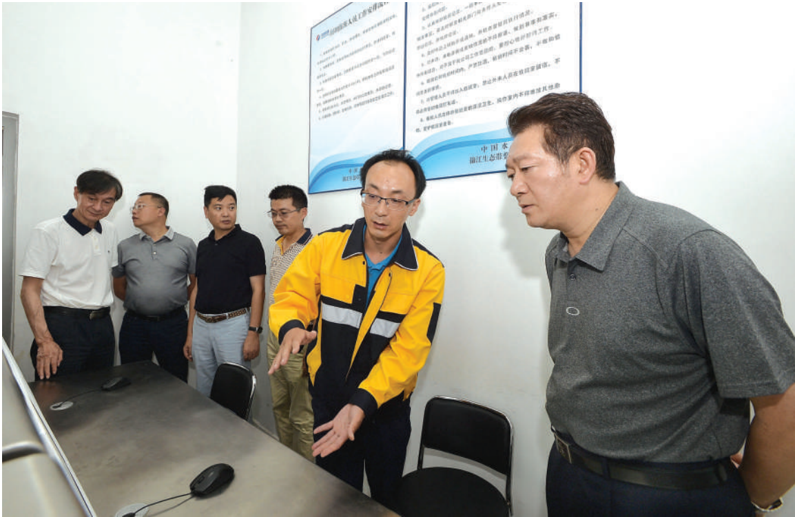
杨林兴率队检查新区地质灾害防治和防汛减灾工作

7月1日,市政协副主席、天府新区成都党工委副书记杨林兴率队,深入天府新区在建工地、河流堤坝、地质灾害隐患点,前往天府新区成都管委防汛抗旱指挥部值班室,检查地质灾害防治和防汛减灾工作,并对新区防汛及地质灾害隐患排查防治工作作出进一步要求,全力争取安全、平稳度过今年7、8、9月的主汛期。