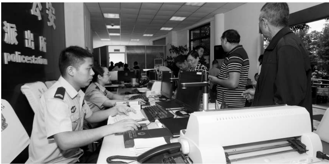
太平派出所公安“一站式服务”办证点

凡户口登记在四川省的居民,在天府新区公安办证中心申报办理省内跨市州户口迁入时,均可直接到户政窗口申请按照户口迁移“省内一站式”服务办理迁入业务。但存在户口真伪存疑、户口被冻结的,暂无法办理“省内一站式”迁移业务,需查清解冻后才能办理;存在户口相关信息需进一步核查、有违法犯罪嫌疑人被立案调查、不按要求开展户籍和实有人口登记工作等相关问题状况的,仍然按照原有户口迁移准迁迁入流程规范执行;省内大中专学生户口迁移、16岁以上成年人在省级人口信息系统中无身份证照片信息的,仍按原有户口迁移流程规范执行。