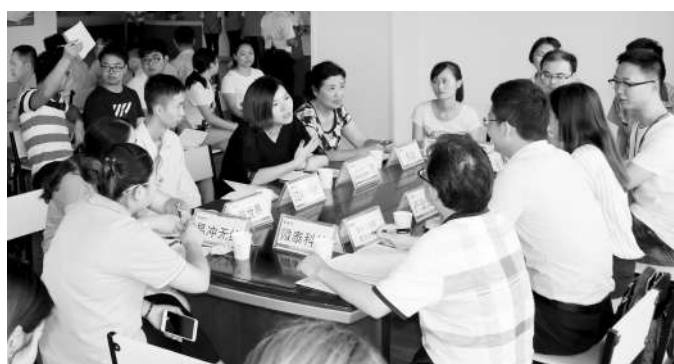
成都天投集团天科创造产业基地党群服务中心举行座谈会

8月14日，新区首家围绕产业基地建立的党群服务中心——成都天投集团天科创造产业基地党群服务中心在新兴工业园揭牌成立。