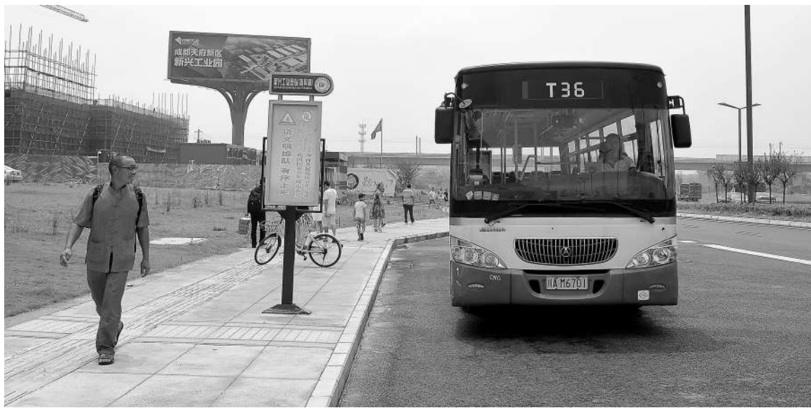
新兴工业园公交站，乘客搭乘T36公交出行

近年来，为进一步提升街道公共交通服务能力，满足百姓公交出行需求，新兴街道积极与公交公司