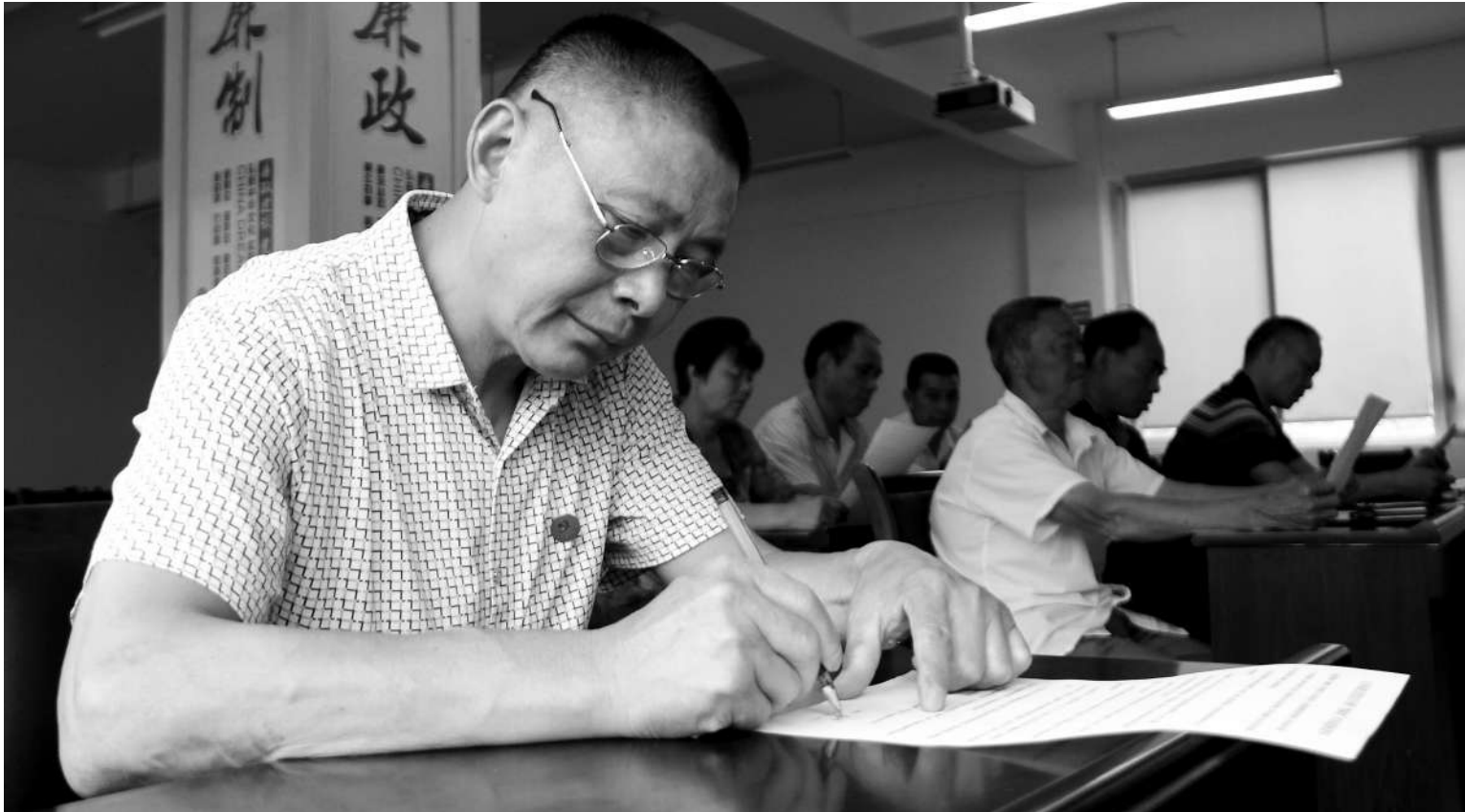
正兴街道云顶党总支党员干部签订“微腐败”承诺书

打造6个党建示范型阵地,开展各种主题活动,创立自己的党建品牌……今年正兴街道从顶层设计、阵地建设、主题活动、品牌建设四个方面入手,结合正兴实际,大力推进基层党建有形化建设,努力提升党建显示度,让党员干部和群众都明明白白地知道,党建到底怎么做,做什么。