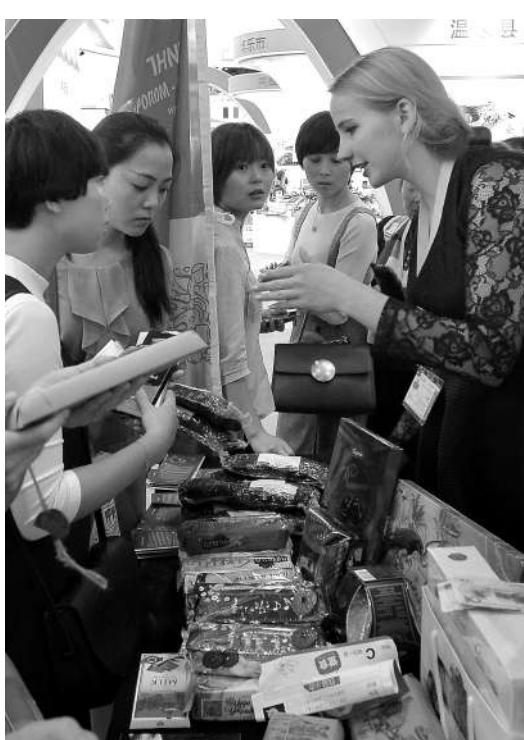
白俄罗斯商家推销糖果