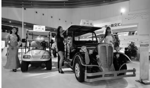
参展的新能源老爷车