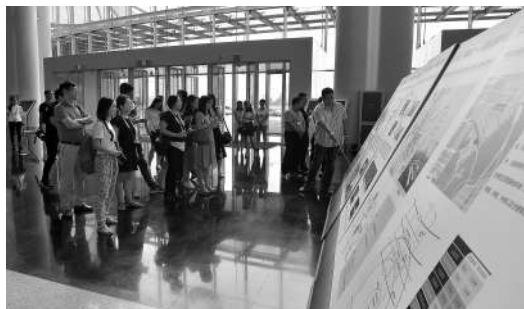
香港媒体记者在西博城采访