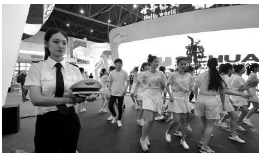
参加快闪游戏的女青年