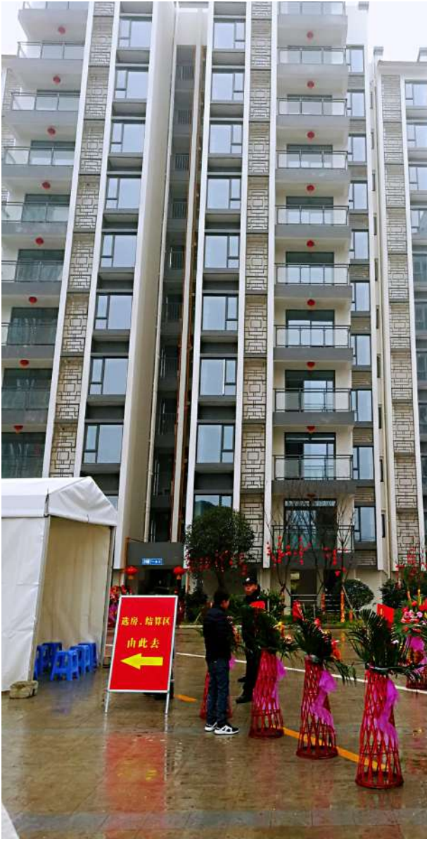
9 - à $ % + \

2019年初,成都气温骤降,寒气袭人,但天府新区太平街道太和星月项目门口却是人头攒动,一派热闹景象。这一天,是太平街道安置房项目——太和星月小区交付的大喜之日,安置户们一大早来到交房现场,“喜提”新房。