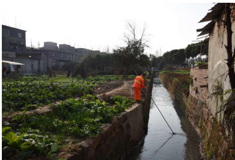
* ā Ā B Á , p % ÿ

发现问题后,万安街道立即召开了街道党工委会议,对相关问题进行研究和解决。天府之声记者了解到,一个星期之内,该街道对曝光河道段进行垃圾全部打捞,并按照河长制的相关工作要求,聘请专人进行河道护理,下流的截污池建成即将投用;同时,场镇上市民如厕问题也得以解决。