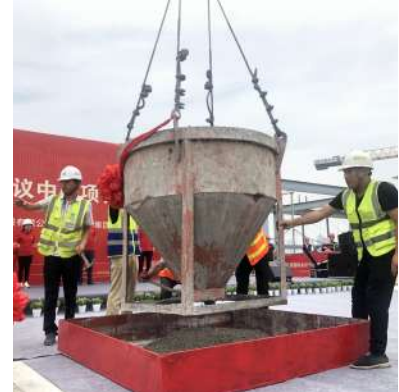
天府国际会议中心主体结构封顶，浇筑最后一方混凝土

6月30日上午10时，随着最后一方混凝土浇筑完成，由万科和成都天投集团共同打造、天府投资控股有限公司(简称天府投控)负责投资开发建设、中建三局施工总承包的天府国际会议中心主体结构全面封顶。